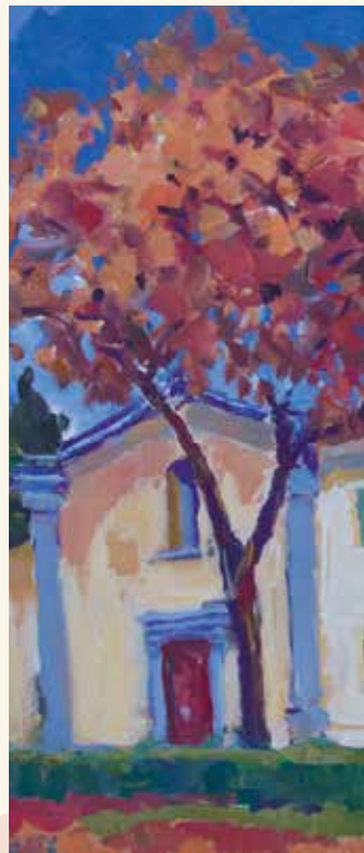
Chiesa dei Santi Martino e Giusto olio e acrilico su tela, cm. 60x80, 2016