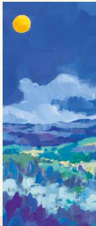
Luna sul guardingo Lucardo olio e acrilico su tela, cm. 30x30, 2017