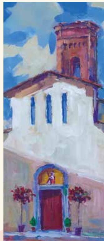
Taglio di luce Chiesa di Sant'Andrea olio e acrilico su tela, cm. 80x60, 2017