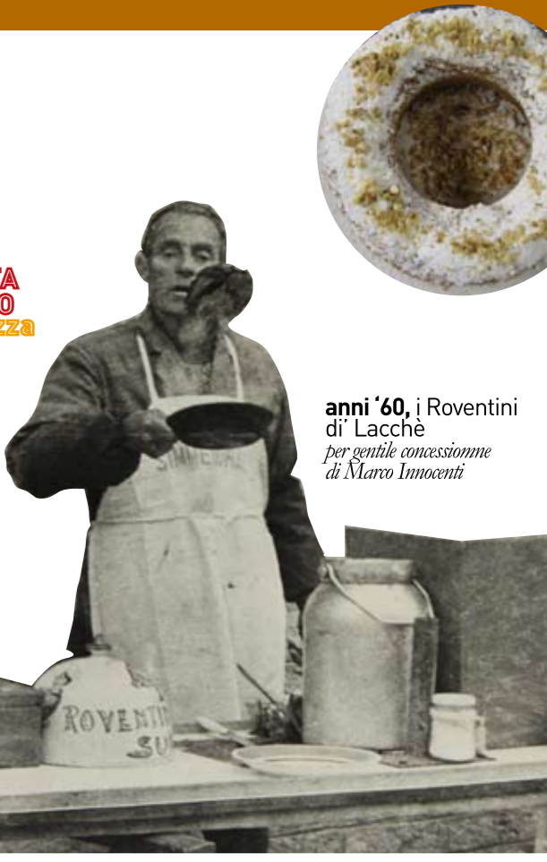
anni '60, i Roventini di Lacché per gentile concessione di Marco Innocenti

Main sponsor: coop UNICOOP FIRENZE , BCC , Signa , Mukki Sponsor: ACQUA PANNA , PETROLGAS , UNITED COLORS OF BENETTON